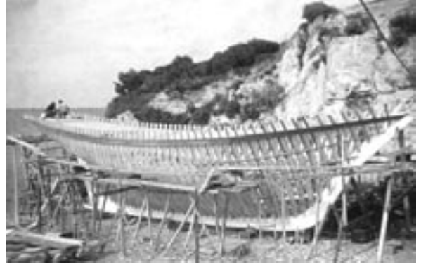
Σκάρωμα σκάφους, Θάσος

Η μελέτη του τοπίου δεν οδηγεί οπωσδήποτε σε λύσεις των προβλημάτων· όμως συμβάλλει τουλάχιστον στη διατύπωση γόνιμων ερωτήσεων. Μετά την καταγραφή των πληροφοριών από την έρευνα πεδίου, 21 απαραίτητη κρίνεται η αξιοποίηση και άλλων διαθέσιμων συναφών πηγών, όπως ο χάρτης, η παλαιά φωτογραφία, το χαρακτηριστικό, ο πίνακας ζωγραφικής, η αεροφωτογραφία, το τοπογραφικό σχέδιο, το κτηματολόγιο παρωχημένων εποχών, ώστε να διασταυρωθούν οι