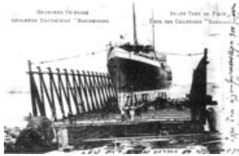
Η σκάρα του ναυπηγείου «Βασιλειάδη», Πειραιάς (επιστολικό δελτάριο εποχής)

Η βιομηχανική κληρονομιά , αντικείμενο της βιομηχανικής αρχαιολογίας και της οικονομικής ιστορίας, αποτελεί σημαντικό πεδίο της τοπικής ιστορικής έρευνας. Μελετώντας τους χώρους εργασίας, το εργοστάσιο ή το νερόμυλο, αξιοποιούμε ένα σημαντικό τομέα της ιστορίας. Η μελέτη αυτών των χώρων, σε συνδυασμό με άλλες πηγές, μπορεί να αναδείξει συνθήκες και τρόπους ζωής, καταστάσεις και ανθρώπινες σχέσεις, το εργασιακό κλίμα μιας εποχής, τις ελπίδες, τις φιλοδοξίες, την ανθρώπινη προσπάθεια και το μόχθο για επιβίωση και δημιουργία. Ο ερευνητής θα μιλήσει με τους μάρτυρες, παλαιούς εργάτες και εργοδότες, θα μελετήσει φακέλους και αποδείξεις πληρωμών, αριθμό προσωπικού, προέλευση, καταγωγή, κοινωνική τάξη, αλλά θα θέσει και ερωτήματα όπως: Γιατί δημιουργή-