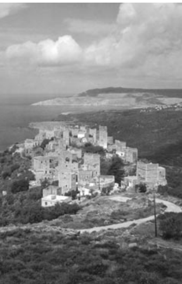
Η Βάθεια με τους χαρακτηριστικούς πύργους της, Μάνη

τό, επειδή αποτελούν δυνητικά ιστορικό τεκμήριο, αρκεί να κατέχουμε τον κώδικα ανάγνωσής του. 19 Ένα εγκαταλελειμμένο στοιχείο του τοπίου, είτε πρόκειται για αστική συνοικία ή αγροτικό οικισμό ή και ένα κτίσμα, αποτελεί ερέθισμα, καθώς θέτει ερωτήματα (πότε, γιατί, πώς, πού κτλ.), των οποίων οι απαντήσεις δεν είναι έργο της φαντασίας αλλά της έλλογης και μεθοδικής τεκμηρίωσης. Δεν αποκλείεται βέβαια το ίδιο το τοπίο να παρέχει τα δεδομένα για ερμηνείες αναφορικά με τις παρεμβάσεις του ανθρώπου σ' αυτό. Η μελέτη του τοπίου σε συνδυασμό με αυτήν των χαρτών, τοπογραφικών σχεδίων, παλαιών απεικονίσεων ή και αεροφωτογραφιών είναι δυνατόν να φωτίσει πολλά από τα ζητούμενα της τοπικής ιστορίας.