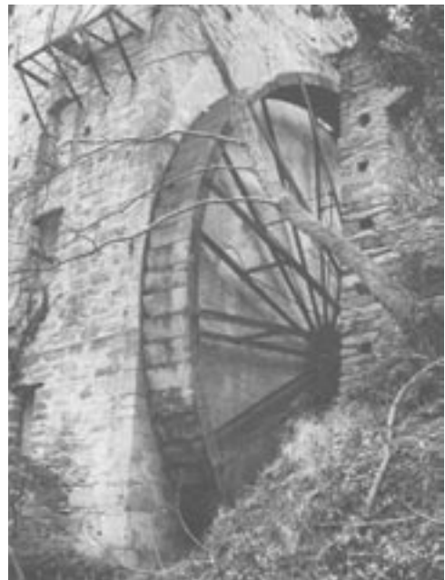
Νερόμυλος με όρθια φτερωτή