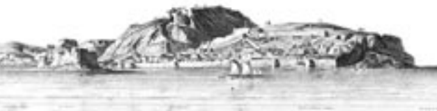
Άποψη Ναυπλίου από θάλασσα (διακρίνονται το Μπούρτζι, το Παλαμήδι και η Ακροναυπλία), Λιθογραφία, 1829

Γιατί στις ερευνητικές ομάδες της τοπικής ιστορίας κάθε μαθητής έχει κάποιο ρόλο να παίξει, ανάλογα με τις ιδιαίτερες ικανότητες και προτιμήσεις του. Καθώς μάλιστα στις διαδικασίες αυτές συμμετέχουν και μαθητές καταγόμενοι από άλλες περιοχές, είναι αυτονόητο ότι η συμμετοχή αυτή είναι σημαντική για την ένταξή τους στην τοπική κοινωνία, ενώ ο ρόλος τους μπορεί να αποδειχθεί ιδιαίτερης σημασίας, αφού μεταφέρουν στην ομάδα γνώσεις, εμπειρίες και απόψεις για ανάλογα ζητήματα που αφορούν τον τόπο προέλευσής τους, τροφοδοτώντας τις σχετικές συγκρίσεις.