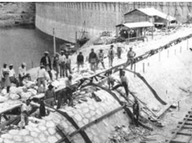
Εργοτάξιο στο φράγμα του Μαραθώνα, 1928

Τ α χαρακτηριστικά της τοπικής ιστορίας, ως πεδίου εκπαιδευτικών διεργασιών, την αναδεικνύουν σε εξαιρετικά χρήσιμο εργαλείο συστηματικής προώθησης θετικών μαθησιακών δραστηριοτήτων, που καλύπτουν όλο το φάσμα των διδακτικών αρχών.