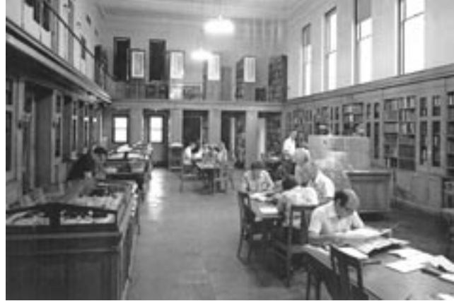
Γεννάδειος Βιβλιοθήκη, Αμερικανική Σχολή Κλασικών Σπουδών, Αναγνωστήριο, Αθήνα