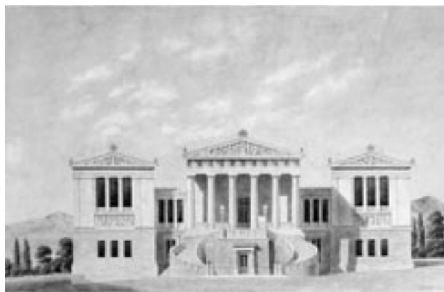
Η Εθνική Βιβλιοθήκη

Είναι προφανές ότι οι άξονες αυτοί χρειάζεται να εξειδικευτούν σε συγκεκριμένες δραστηριότητες, για την ολοκλήρωση των οποίων θα διαμορφωθεί χρονοδιάγραμμα. Θα προσδιοριστούν επίσης οι βασικές πη-