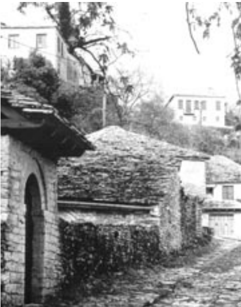
Καλντερίμι. Χρήση της πέτρας στην οικοδόμηση και την οδοποιία στην Ήπειρο

Μέσα σε αυτό το πλαίσιο η τοπική ιστορία 2 αποτελεί ιδιαίτερο τρόπο προσέγγισης του ανθρώπινου παρελθόντος από την άποψη της κλίμακας, καθώς ο χώρος αναφοράς της τοποθετείται μεταξύ της γενικής ιστορίας και της οικογενειακής, ή της βιογραφίας. Ως προς την επιλογή και την επεξεργασία των θεμάτων της, πρέπει να υπογραμμίσουμε ότι η τοπική ιστορία δεν ταυτίζεται με τη λαογραφία, επιστήμη που παρέχει σημαντική υποστήριξη στον ιστορικό,