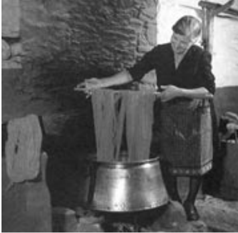
Βάψιμο με φυτική βαφή, Αμπελάκια