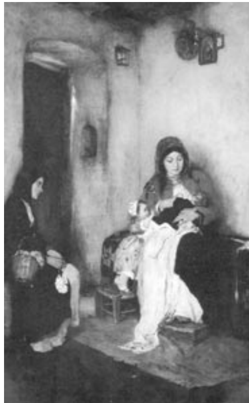
Νικόλαος Γύζης, Η ψυχομάνη

Ενδιαφέρον, επίσης, για την τοπική ιστορία παρουσιάζουν τα ανθρωπωνύμια . Μπορεί κανείς να αρχίσει την έρευνα στο πεδίο αυτό από τα τοπικά αρχεία, το ληξιαρχείο, το δημοτολόγιο, τα πιστοποιητικά βαπτίσεων, γάμων, θανάτων, αλλά και από προφορικές μαρτυρίες στο εσωτερικό της οικογένειας ή περιορισμέ-