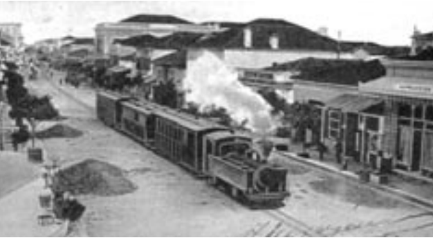
Το τρενάκι του Πηλίου στο Βόλο (κάρτ ποστάλ εποχής)

της εργασίας παρέχει στα μέλη της ερευνητικής ομάδας την ικανοποίηση ότι συνέβαλαν δημιουργικά στην αυτογνωσία της κοινωνίας στην οποία ανήκουν. Πρόκειται για ανταμοιβή που σφραγίζει το τέλος της εργασίας και η οποία βιώνεται εντονότερα όταν οι μαθητές έχουν την κοινωνική αναγνώριση της προσπάθειάς τους μέσα από εκδηλώσεις, εκθέσεις, διαλέξεις και δημοσιεύματα, που προβάλλουν τα αποτελέσματα του μόχθου τους στην τοπική κοινωνία.