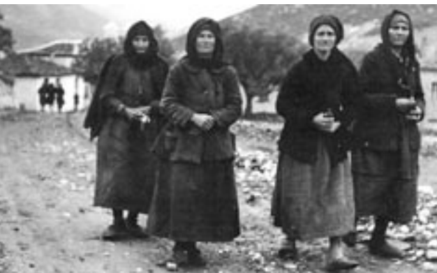
Δίστομο, 1945: Μαυροφόρες, ένα χρόνο μετά τη δολοφονία των κατοίκων από τους Ναζί

Για τους λόγους αυτούς χρειάζεται να τηρούνται ορισμένοι κανόνες (βλ. δείγμα 6). Η έρευνα για τον εντοπισμό των κατάλληλων προσώπων από τα οποία θα ζητηθεί η συνέντευξη είναι απαραίτητη. Είναι προφανές ότι μία και μοναδική συνέντευξη δεν παρέχει τα εχέγγυα της αντικειμενικότητας, και σκόπιμο είναι να προσφεύγουμε σε μια επαναληπτική συνέντευξη επιβεβαίωσης, που θα πραγματοποιηθεί σε απόσταση ικανού χρόνου από την προηγούμενη. 23 Ο μαθητής που παίρνει τη συνέντευξη θα πρέπει να αντιληφθεί ότι δε λειτουργεί ως δημοσιογράφος ούτε ως ανακριτής. Ειδικότερα, απαιτείται η κατάλληλη προετοιμασία με πρωταρχικό μέλημα τη διατύπωση του ερωτήματος: «Τι με ενδιαφέρει να πληροφορηθώ». Το ερώτημα αυτό θα αναλυθεί σε ειδικότερα ερωτήματα που θα τεθούν στο συ-