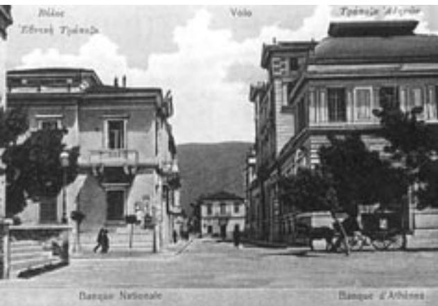
Νεοκλασική αρχιτεκτονική (επιστολικό δελτάριο), Βόλος, 1900

θύλους κτλ.). Μέσα από την έρευνα θεμάτων τοπικής κλίμακας, ο μαθητής έρχεται σε επαφή με το τοπικό παρελθόν συστηματικά και, αυτενεργώντας, προσεγγίζει τα προβλήματα του τόπου και τις λύσεις που δόθηκαν σε παλαιότερες εποχές, αξιολογεί παρωχημένες καταστάσεις, τις συγκρίνει με το παρόν και σφυρηλατεί σε μια έλλογη βάση τους δεσμούς του με τον τόπο στον οποίο ζει. Παράλληλα, η