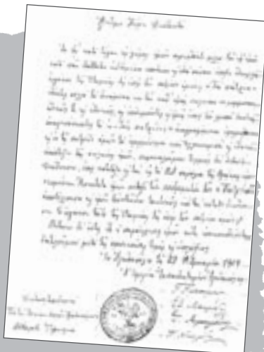
Επιστολή της Εφορείας Εκπαιδευτηρίων Αγαθουπόλεως προς το διευθυντή της εφημερίδας Τα πάτρια (28 Φεβρουαρίου 1909)

Η τοπική ιστορία εντάσσει στη θεματολογία της και τη θρησκευτική ζωή . Μολονότι το θέμα τούτο είναι λεπτό, η ιστορία της Εκκλησίας και της θρησκείας είναι πλουσιότατη και ενδιαφέρουσα. 29 Ιδιαίτερα σε περιόδους ξενοκρατίας, ο ρόλος της Εκκλησίας στάθηκε εξαιρετικά σημαντικός σε τομείς όπως η παιδεία, η γλώσσα, η απονομή της δικαιοσύνης κ.ά. Ιδιαίτερο ενδιαφέρον παρουσιάζουν οι δραστηριότητες των κληρικών και η θέση τους στην τοπική κοινωνία. Η μελέτη εκκλησιαστι-