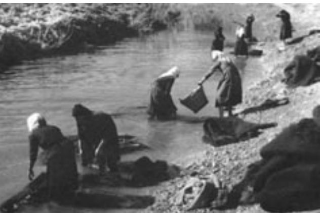
Πλύσιμο φλοκάτης, Βούλα Τρικάλων, 1961

Η μελέτη της τοπικής ιστορίας στο σχολείο είναι καθοριστική για τη σύνδεση στη συνείδηση των μαθητών, μέσα από τις συγκεκριμένες πραγματικότητες του φυσικού και κοινωνικού χώρου, των επιπτώσεων των