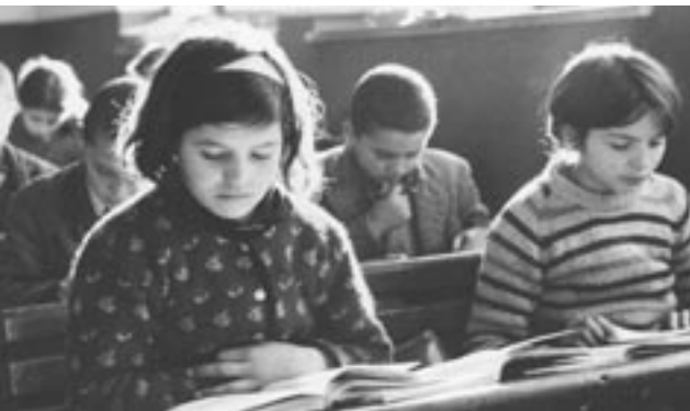
Μαθητές στα θρανία

Δεν είναι λιγότερο ενδιαφέρουσα η έρευνα για τις μεθόδους και τις τεχνικές που χρησιμοποιούνταν στις καλλιέργειες, στις βιοτεχνίες και στα διάφορα κοινοτικά ή δημόσια έργα. Μερικές από τις τεχνικές αυτές ήταν ιδιαίτερες, καθώς επιχωρίαζαν σε συγκεκριμένες περιοχές, όπως η κατεργασία της πέτρας στην Ήπειρο (γεφύρια με καμάρες, σπίτια παραδοσιακά κτλ.), της γούνας στην Καστοριά, του μεταξιού στο Σουφλί, η παραδοσιακή ιχθυοκαλλιέργεια στο Μεσολόγγι κ.ά.