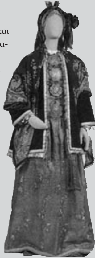
Παραδοσιακή γυναικεία φορεσιά από τη Σύμη

Η τοπική ιστορία , από την άποψη των ερευνητικών και μεθοδολογικών προσεγγίσεων, δε διαφέρει από οποιαδήποτε άλλη ιστοριογραφική δραστηριότητα· με τον όρο αυτό δηλώνεται απλώς ότι η έρευνα και η μελέτη πραγματοποιούνται σε τοπική κλίμακα· όλα αυτά βέβαια με την παρατήρηση ότι η μελέτη του τοπικού δεν είναι δυνατόν να κατανοηθεί, να περιγραφεί και να εξηγηθεί, χωρίς τη γνώση της ιστορίας του ευρύτερου χώρου.