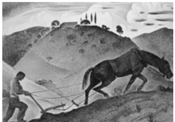
Βάλια Σεμερτζίδα, Το όργωμα