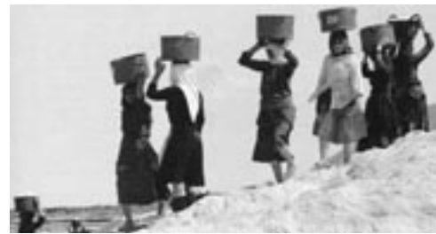
Λευκαδίτισσες μεταφέρουν το προϊόν των αλυκών, 1960

αυτή, πέρα από τις πληροφορίες, ενδεχομένως εντοπίζονται και αξιοποιούνται οι παραλείψεις, οι συγχύσεις, οι σιωπές, οι επαναλήψεις και οι αντιφάσεις. Συχνά, τα στοιχεία αυτά επιβάλλουν την αναζήτηση και άλλης προφορικής πηγής. Ας λάβουμε υπόψη επίσης ότι, αν το θέμα έχει ευρεία δημοσιότητα και βιβλιογραφία, ο συνομιλητής μας πιθανόν να έχει επηρεαστεί από απόψεις τρίτων. Για την άντληση συμπερασμάτων για ευρύτερα στρώματα, τάξεις και κατηγορίες, απαραίτητο είναι να λαμβάνονται συνεντεύξεις από περισσότερα πρόσωπα, και μάλιστα με διαφορετικά κριτήρια επιλογής τους (τάξη, φύλο, ηλικία, επάγγελμα κ.ο.κ.).