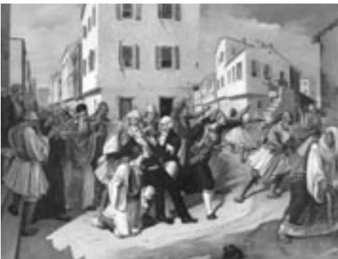
Χαράλαμπος Παχής, Η δολοφονία του Καποδίστρια

ντος, ο οποίος χρειάζεται να προετοιμαστεί για τη συζήτηση με τους μαθητές, προκειμένου να διατυπώσουν το θέμα από κοινού. Είναι γεγονός ότι, κατά κανόνα, στις διατυπώσεις των θεμάτων τοπικής ιστορίας δύο παράγοντες αναφέρονται ρητά ή υπολανθάνουν: ο τόπος και οι άνθρωποι . Αυτοί αποτελούν το δίπολο, γύρω από το οποίο στρέφεται η θεματική της τοπικής ιστορίας. Η διερεύνηση του πρώτου πόλου είναι άκρως απαραίτητη, καθώς συμβάλλει αποφασιστικά στην απάντηση ερωτημάτων αναφερόμενων στους τρόπους με τους οποίους οι ιδιαιτερότητες του τόπου επηρέασαν τους ανθρώπους.