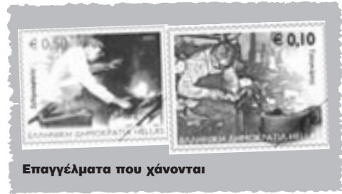
Επαγγέλματα που χάνονται

Ιδιαίτερο ενδιαφέρον για την τοπική ιστορία έχει εκδηλωθεί και στη χώρα μας τις τελευταίες δεκαετίες. 12 Στο πλαίσιο αυτού του ενδιαφέροντος μπορούμε να εντάξουμε και όσα πραγματοποιούν πολλά μουσεία, σε συνεργασία με τα υπουργεία Πολιτισμού και Παιδείας, όπως, λ.χ., η εκπόνηση μελετών και η οργάνωση εκπαιδευτικών προγραμμάτων, όπου οι μαθητές συμμετέχουν ενεργά. Παράλληλα, με-