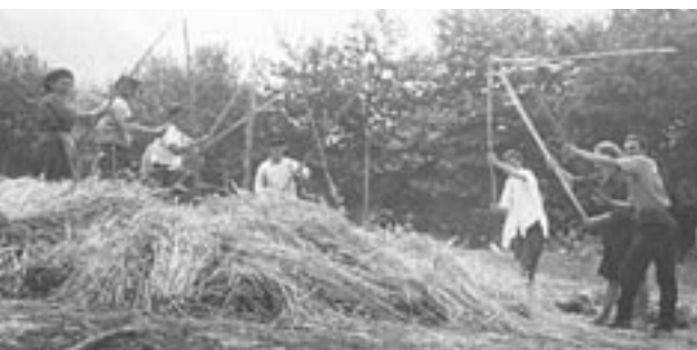
Το αλώνισμα του σταριού με το δάρτη, Μελισσουργοί Άρτας, 1965

σχέση των μελών μεταξύ τους, η διαμόρφωση και η εξέλιξη των κοινωνικών ομάδων ή τάξεων, ο αριθμός και η θέση των ανέργων ή των ατόμων με ειδικές ανάγκες, η θέση των διάφορων κατηγοριών αποκλιόντων μέσα στην τοπική κοινωνία (περιθωριακών, γραφικών τύπων κ.ο.κ.). Χρήσιμη είναι, εξάλλου, για τα συμπεράσματα στα οποία μπορεί να οδηγήσει, η έρευνα για τη στάση του συνόλου έναντι των ασθενέστερων κοινωνικών ομάδων.