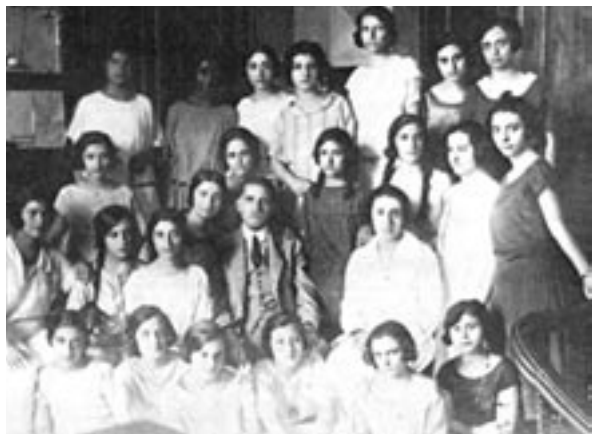
Μαθήτριες της Εμπορικής Σχολής, Αθήνα, 1920

Πέρα από τη δυνατότητα αξιοποίησης των καλλιτεχνικών έργων ως συμπληρωματικών πηγών πληροφόρησης στην έρευνα, είναι δυνατόν να διατυπωθούν θέματα τοπικής ιστορίας που να επιτρέπουν να χρησιμοποιηθούν για την τεκμηρίωσή τους αποκλειστικά συγκεκριμένες κατηγορίες καλλιτεχνικών πηγών από χώρους της λογοτεχνίας, του κινηματογράφου κ.ο.κ., όπως: