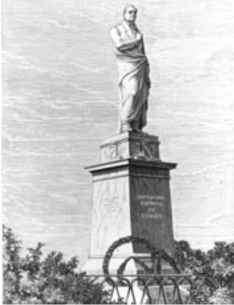
Άγαλμα του Ιωάννη Καποδίστρια (έργο του Λεωνίδα Δρόση, 1885), Κέρκυρα

ώστε η μελέτη της να οδηγήσει, στο πλαίσιο της σχολικής διαδικασίας, στα προσδοκώμενα