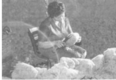
Το ψαλίδισμα των σφουγγαριών στην Κάλυμνο