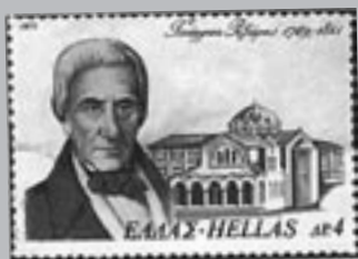
Γραμματόσημο προς τιμήν του ευεργέτη Γ. Ριζάρη, στο οποίο απεικονίζεται και η Ριζάρειος Σχολή

γές πληροφόρησης, που μπορεί να είναι τα βιβλία αναγνωστηρίου και δανεισμού, ερωτηματολόγια για τους υπαλλήλους, εκθέσεις της διεύθυνσης της βιβλιοθήκης προς τις προϊστάμενες αρχές, προγράμματα πολιτιστικών εκδηλώσεων, πιθανές εκδόσεις του ιδρύματος, συνεντεύξεις με τους εργαζόμενους και τους χρήστες κτλ. Χρειάζεται επίσης να συμφωνηθούν οι τρόποι καταγραφής και ταξινόμησης των δεδομένων, ενδεχομένως η δυνατότητα ένταξής τους σε μια ηλεκτρονική βάση, καθώς επίσης να ληφθεί υπόψη η ικανότητα των μαθητών να καταρτίζουν στατιστικούς πίνακες από τα δεδομένα της έρευνας, ώστε αυτοί να συμπεριληφθούν στην τελική σύνθεση που θα πραγματοποιηθεί σε ολομέλεια. Είναι επίσης αυτονόητο ότι ο διδάσκων φροντίζει ώστε τα μέλη των ομάδων να είναι εφοδιασμένα με το απαραίτητο κατά δραστηριότητα υλικό (μπλοκ σημειώσεων, φωτοτυπίες ερωτηματολογίων, φωτογραφική μηχανή, μαγνητόφωνο, κάμερα βιντεοσκόπησης).