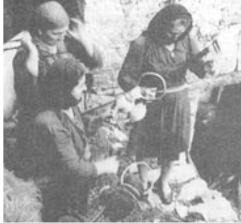
Γυναίκες στο μύλο περιμένοντας το άλεσμα, Συρράκο, 1971

Όπως έχει επισημανθεί από πολλές πλευρές, η γενική ιστορία αποτελεί ουσιαστικά το συνθετικό αποτέλεσμα της επεξεργασίας των δεδομένων τοπικών ιστοριών. Στο πλαίσιο της νέας ιστορίας 6 έχει αναπτυχθεί έντονος προβληματισμός αναφορικά με το ζήτημα των σχέσεων της τοπικής και της γενικής ιστορίας, ζήτημα που τροφοδοτεί έναν ενδιαφέροντα επιστημολογικό διάλογο. Σύμφωνα με μια εκτίμηση, η ευρύτητα του πεδίου αναφοράς της ιστορικής μελέτης δεν έχει σημασία. Σύμφωνα με τον Braudel, εκείνο που έχει σημασία δεν είναι η περιοχή αναφοράς αλλά το πρόβλημα. Εντούτοις, ο σημαντικός αυτός ιστορικός θεωρούσε εξαιρετικά ενδιαφέρονσα και την ενασχόληση με το γεγονός, τη λεπτομέρεια και τη μοναδικότητα. Τα μέχρι τώρα συμπεράσματα του διαλόγου αυτού επισημαίνουν ότι η τοπική ιστορία δεν αποτελεί αντίθεση της γενικής, αλλά ότι απαιτείται να προσδιοριστούν με σαφήνεια οι σχέσεις τους και οι δυνατότητες συμβολής τους στην κατανόηση του ανθρώπινου παρελθόντος. Στο