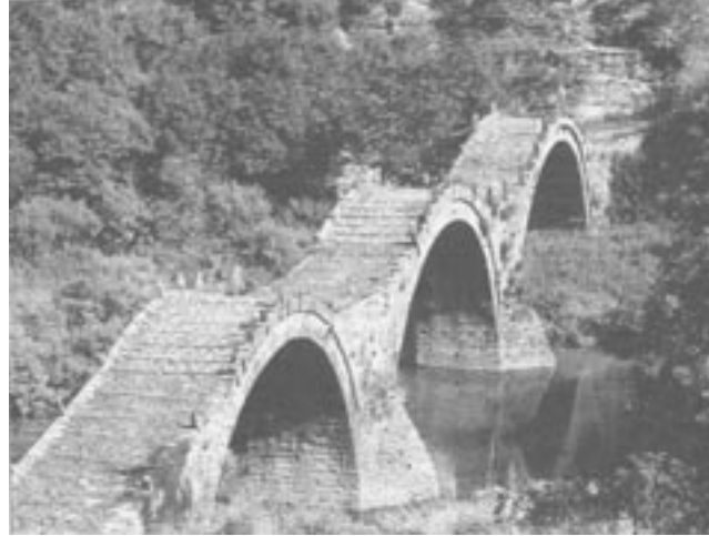
Το γεφύρι του Πλακίδα, χτισμένο το 1814, κοντά στους Κήπους Ζαγορίου

Ας χρησιμοποιήσουμε ένα παράδειγμα προβληματισμού ως προς τη διατύπωση του θέματος. Γνωρίζοντας από τη γενική ιστορία το σημαντικό ρόλο της σταφιδοπαραγωγής για την εθνική οικονομία, καθώς επίσης τις ποικίλες και σημαντικές επιπτώσεις του σταφιδικού ζητήματος, επιλέγουμε να το μελετήσουμε σε επίπεδο τοπικής ιστορίας στην Ηλεία. Αν επιλέξουμε τη διατύπωση «Η σταφίδα της Ηλείας κατά τα τέλη του 19ου αι.», θα διαπιστώσουμε ότι περιλαμβάνει τρεις έννοιες, από τις οποίες η πρώτη ορίζει το αντικείμενο της έρευνας, ενώ οι δύο άλλες θέτουν το τοπικό και το χρονικό πλαίσιο της. Ουσιαστικά λοιπόν ζητάμε τα πάντα για μία μόνο έννοια, την πρώτη, ενώ απουσιάζει από τη διατύπωση η υπό διερεύνηση σχέση. Είναι προφανές ότι η διατύπωση αυτή δεν είναι καθοδηγητική ως προς το ζητούμενο. Ενδεχομένως υπαγορεύει στους μαθητές να ασχοληθούν με το θέμα σφαιρικά, επιχειρώντας όλες τις δυνατές προσεγγίσεις: πού, πότε, γιατί, πώς κ.ο.κ. Πρόκειται για ένα περίπλοκο σύνολο ερωτημάτων με αρκετές επικαλύψεις, το οποίο είναι βέβαιο ότι θα προκαλέσει σύγχυση. Μια τέτοια διατύπωση, εξάλλου, δεν ανταποκρίνεται στις χρονικές και ερευνητικές προϋποθέσεις της μαθητικής έρευνας, καθώς το αποτέλεσμα μιας τέτοιας έρευνας απαιτεί τη συγγραφή εκτενούς μονογραφίας. Για το λόγο αυτό η παρουσία μίας και μοναδικής έννοιας στο