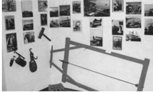
Εκθέματα στο Ναυτικό Μουσείο Καλύμνου

Η επαφή με την τοπική ιστορία είναι περισσότερο επιτακτική σήμερα, που η απειλή της πολιτισμικής αλλοτρίωσης και ισοπέδωσης είναι έντονη, καθώς οι γενικότερες οικονομικές και κοινωνικές δομές επηρεάζουν τις συνήθειες και τις συμπεριφορές των τοπικών και περιφερειακών κοινωνιών. «Όλο και περισσότερο γίνεται παντού κατανοητό ότι βρίσκεται πια σε κίνδυνο η ίδια η συναισθηματική, ηθική και πνευματική υπόσταση του ανθρώπου» ότι η ανία της ομοιομορφίας και η αποδυνάμωση του δικού του συλλογικού πολιτισμού απειλεί την ισορροπία του, την ψυ-