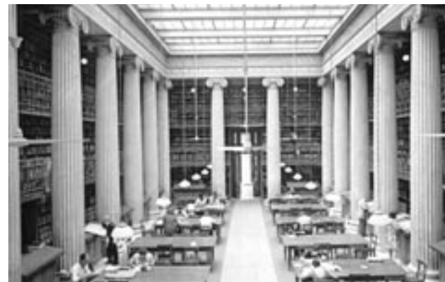
Εθνική Βιβλιοθήκη της Ελλάδας, Αναγνωστήριο