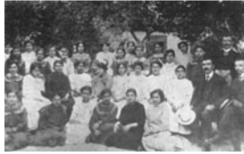
Ο Αλ. Δελημούζος με μαθήτριες και προσωπικό του Παρθενώνα Βόλου, 1911

Οι επισκέψεις σε μουσεία, βιβλιοθήκες και αρχαιολογικούς χώρους αποτελούν συνήθεις δραστηριότητες της σχολικής ζωής. Το περιβάλλον των χώρων αυτών είναι οικείο στους μαθητές και αποτελεί μια ενδιαφέρουσα πηγή αφόρμησης για έρευνα σε επίπεδο τοπικής ιστορίας. Υποθέτουμε ότι έπειτα από συζήτηση στην τάξη, προσανατολιζόμαστε τη σχετική έρευνα στη βιβλιοθήκη της πόλης· ειδικότερα, μας ενδιαφέρει να μελετήσουμε το ρόλο της στον κοινωνικό χώρο. Ο σκοπός του σχεδίου εργασίας, που μπορεί να προκύψει κατά το πρώτο στάδιο, ύστερα από τη συζήτηση, διατυπώνεται με σαφήνεια: «Η συμβολή της Βικελαίας Βιβλιοθήκης στην πνευματική ανάπτυξη της πόλης κατά την τελευταία δεκαετία» (βλ. δείγμα 8).