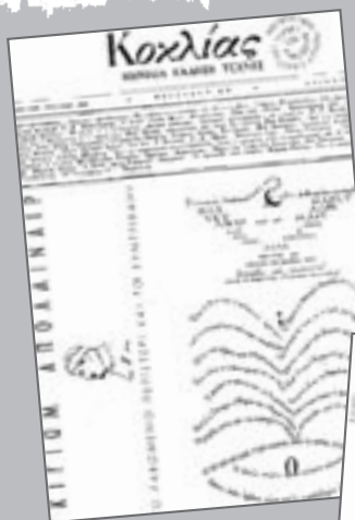
Κοχλίας. Μηνιαίο περιοδικό της Θεσσαλονίκης (Α' τεύχος, Δεκέμβρης 1945)

Περισσότερο αποτελεσματική μπορεί να είναι η αξιοποίηση της πηγής αυτής, όταν