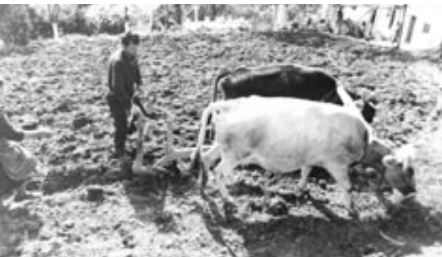
Όργωμα με ζευγάρι βοδιών

νου κύκλου οικογενειών για τα ονόματα, τα επίθετα και τα παρωνύμια. Έχει σημασία να μελετηθεί ο μηχανισμός που καθορίζει το σύστημα απόδοσης των ονομάτων (όνομα γιαγιάς από την πλευρά της μητέρας για την πρωτότοκη κόρη· όνομα παππού από την πλευρά του πατέρα για τον πρωτότοκο γιο· όνομα θανάτος θείου ή άλλου συγγενικού προσώπου, που αποδίδεται στο δεύτερο παιδί· ρόλος αναδόχου κτλ.). Τα παρωνύμια δηλώνουν επαγγέλματα προγόνων, σωματικά χαρακτηριστικά, ελαττώματα και συνήθειες· αντανακλούν, επίσης, κοινωνική συνεισφορά και κοινωνική συμπεριφορά, ενώ λειτουργούν και ως μέσο απελευθέρωσης από κοινωνικές πιέσεις και ατομικά συμπλέγματα. Η μελέτη των σκωπτικών παρωνυμίων σε τοπική κλίμακα είναι πολύ αποκαλυπτική για αξίες και απαξίες της τοπικής κοινωνίας.