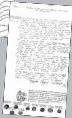
Το έγγραφο της παράδοσης της Μονεμβασίας (Ιούλιος 1821)