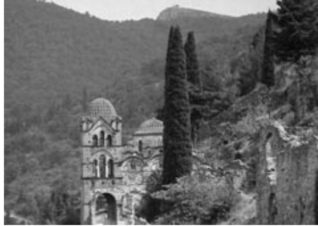
Η βυζαντινή Μονή της Παντάνασσας, 15ος αι., Μυστράς

Από τις πολυάριθμες αυτές κατηγορίες πηγών της τοπικής ιστορίας, πιο προσιτές στους μαθητές αποτελούν το υλικό περιβάλλον και τα στοιχεία του, τα πάσης φύσεως έγγραφα, ο τύπος και οι προφορικές μαρτυρίες και, τέλος, η λογοτεχνική παραγωγή που αναφέρεται στον υπό εξέταση τόπο.