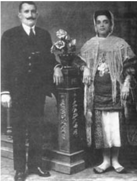
Νεόνυμφοι από το Καστελόριζο. Η νύφη φέρει την τοπική φορεσιά, 1919

ρίες για μια συγκεκριμένη ομάδα ανθρώπων, οι οποίοι έζησαν στο παρελθόν, όπως για τους κατοίκους ενός νησιού, μιας πόλης, ενός χωριού, μιας συντεχνίας, μιας κοινωνικής ομάδας κ.ο.κ., εντάσσεται το έργο τέχνης, το οποίο συχνά προσφέρει πληροφορίες για το παρελθόν της περιοχής. Πίνακες ζωγραφικής, γλυπτά αλλά και φωτογραφικό και κινηματογραφικό υλικό αποτελούν συνήθως πηγές άντλησης πληροφοριών με εξαιρετικό ενδιαφέρον για την τοπική ιστορία. Δεν εξαιρούνται, βέβαια, από τα τεκμήρια της κατηγορίας αυτής τα προϊόντα της τέχνης του λόγου. Ιδιαίτερα πληροφοριακό, εκτός των άλλων, για την τοπική ιστορία είναι το ηθογραφικό λογοτεχνικό είδος, το οποίο ο διδάσκων μπορεί να συστήσει στους μαθητές ως πηγή για την άντληση πληροφοριών τεκμηρίωσης παράλληλα με άλλες, διαφορετικής φύσεως πηγές.