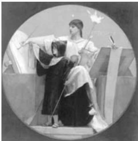
Νικόλαος Γύζης, Ιστορία

έρευνας στα διάφορα στάδιά της. Αυτή η αξιολόγηση πραγματοποιείται σε κλίμα διαλόγου και ανατροφοδότησης. Αξιολογικά κριτήρια που ενδεχομένως θα χρησιμοποιηθούν στη διαδικασία αυτή μπορεί να είναι η τήρηση του χρονοδιαγράμματος, η συνέπεια ως προς την εφαρμογή της ενδεδειγμένης ερευνητικής μεθοδολογίας, οι τρόποι υπέρβασης των δυσχερειών και η πληρότητα της τεκμηρίωσης των συνθετικών εργασιών των ομάδων. Όσον αφορά τη συνολική αξιολόγηση , αυτή είναι βέβαιο ότι θα ωφελήσει, υπό την έννοια ότι ο διδάσκων σε μια επόμενη ανάλογη διαδικασία θα λάβει υπόψη του τα σχετικά πορίσματα, ώστε να αποφύγει προβλήματα και δυσλειτουργίες που προέκυψαν στη διάρκεια των μαθημάτων.