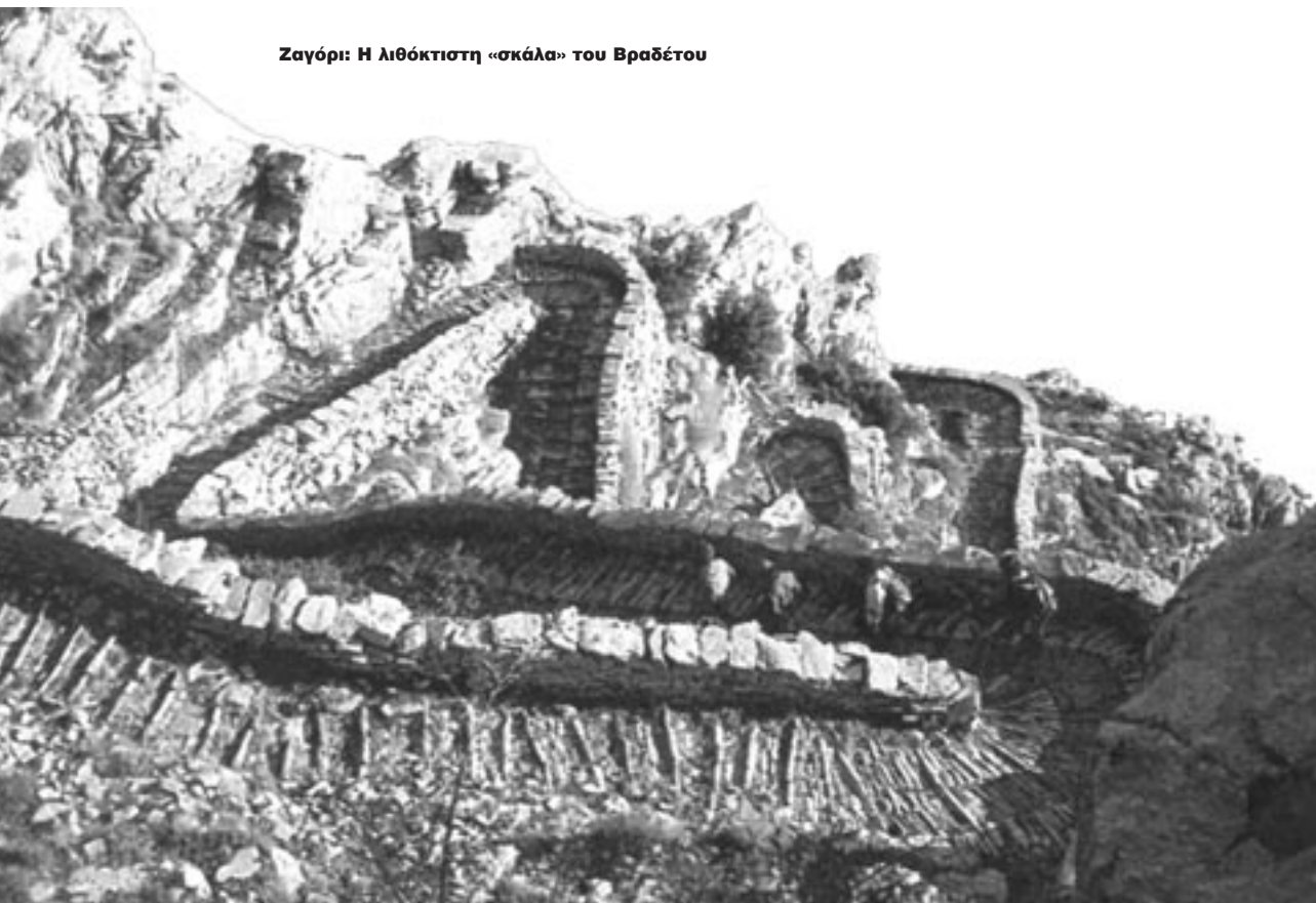
Ζαγόρι: Η λιθόκτιστη «σκάλα» του Βραδέτου