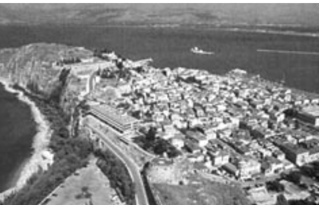
Άποψη του Ναυπλίου